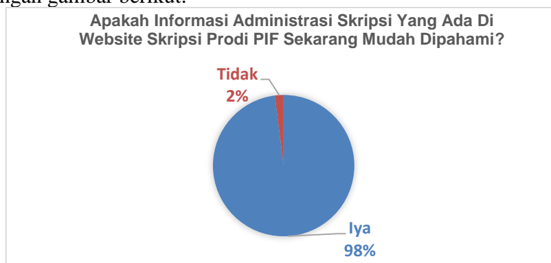
Gambar 3. Hasil uji Respon mahasiswa

Hasil pada Tabel 2 menunjukkan bahwa ahli materi memberikan penilaian sebesar 86% dan ahli media memberikan penilaian sebesar 96%. Hal ini menunjukkan bahwa website administrasi skripsi telah sangat layak untuk digunakan dan diimplementasikan pada mahasiswa. Pada tahap implementasi, hasil dari pengembangan website administrasi skripsi kemudian disosialisasikan kepada mahasiswa semester akhir untuk mengetahui respon dari mahasiswa tentang website administrasi skripsi dengan menggunakan google form . Tahapan evaluasi dilakukan setelah prosedur-prosedur pada tahapan implementasi dilakukan. Dalam pengembangan ADDIE tahapan evaluasi merupakan tahapan akhir dalam proses penelitian ini. Tujuan penggunaan tahapan evaluasi untuk mengukur ketercapaian tujuan pengembangan website administrasi skripsi. Penerapan dilakukan untuk mendapat respon dari mahasiswa dan ditunjukkan dengan gambar berikut.