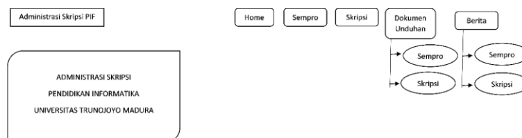
Gambar 2. Flowchart Awal Kerangka Website Administrasi Skripsi

Penelitian ini bertujuan untuk memberikan sebuah informasi yang spesifik kepada mahasiswa yang berupa website administrasi skripsi. Hasil pengembangan website administrasi skripsi meliputi beberapa menu yaitu home, seminar proposal, skripsi, dokumen unduhan (seminar proposal dan skripsi) dan berita (seminar proposal dan skripsi). Hasil pembuatan melingkupi prosedur dalam pembuatan akan di tampilkan di dalam flowchart dengan kerangka awal yang sekiranya dapat berintegrasi terhadap pembuatan website administrasi skripsi. Flowchart merupakan aplikasi berasal dari rancangan kerangka awal sebelum pembuatan website administrasi skripsi, supaya kerangka ini bisa dilanjutkan untuk pembuatan website ini. Jadi website administasi ini berangkat dari kerangka awal flowchart untuk menentukan tata letak menu-menu yang ada di website administrasi skripsi sebagaimana yang disajikan pada gambar 2 berikut ini;