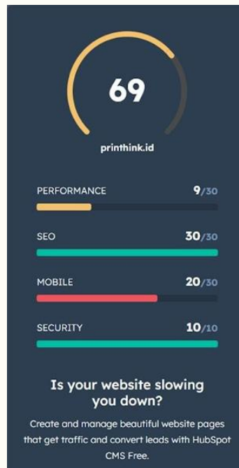
Gambar 5. Tampilan Status Website Printhink.id

Pada Gambar 5. menampilkan website percetakan yaitu Printhink.id bahwa kapasitas keseluruhan website Printhink.id dari 4 indikator memperoleh skor angka 69 dengan berwarna kuning yang berarti menandakan bahwa website Printhink.id itu bersifat lumayan. Indikator