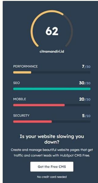
Gambar 2. Tampilan Status Website Citramandiri.id

Pada Gambar 2. menampilkan website percetakan yaitu Citramandiri.id bahwa kapasitas keseluruhan website Citramandiri.id dari 4 indikator memperoleh skor angka 62 dengan berwarna kuning yang berarti menandakan bahwa website Citramandiri.id itu bersifat baik. Indikator pertama yaitu performance pada website Citramandiri memperoleh skor angka 7 sampai 30 namun terdapat berwarna merah yang berarti menandakan itu buruk. Indikator kedua yaitu SEO pada website Citramandiri memperoleh skor angka 30 dari 30 namun terdapat berwarna hijau yang berarti menandakan itu baik. Indikator ketiga yaitu Mobile pada website Citramandiri memperoleh skor angka 20 dari 30 namun terdapat berwarna merah yang berarti menandakan itu buruk. Terakhir ada indikator keempat yaitu Security pada website Citramandiri memperoleh skor angka 5 dari 10 namun terdapat berwarna merah yang berarti menandakan itu buruk.