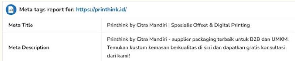
Gambar 6. Tampilan Meta Tags Report Website Printhink.id

Hasil analisis berikut meliputi perbandingan dari website Citramandiri.id dan Printhink.id yang telah diuji menggunakan tools similarweb.com, website.grader.com, dan smallseotools.com. Hasil Perbandingan Website Melalui Similarweb.com. Berdasarkan tabel 1. dapat dilihat perbandingan antara website Citramandiri.id dan Printhink.id pada similarweb.